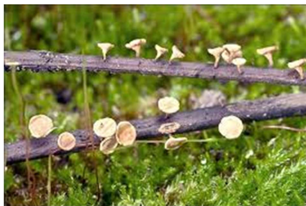
falsches weisses Stelgelbecherchen

Die Eschenwelke (Eschensterben) verbreitet sich ungebremst immer mehr in den Schweizer Wäldern. Aus Sicherheitsgründen mussten entlang von Verkehrswegen und Erholungseinrichtungen die vom Pilz (falsches weisses Stelgelbecherchen) befallenen Eschen entfernt werden.